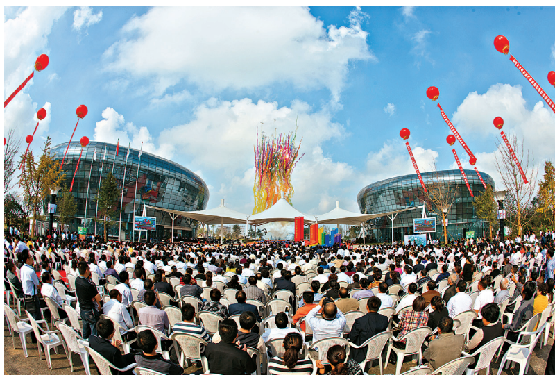
图 14-2 2011年9月26日,第七届江苏省园艺博览会开幕式

2009年,湖畔家苑、中德度假村、中国水城等一批旅游服务业项目相继落户湖滨新城。全年接待游客55万人次,同比增加10.3%;旅游产业收入2300万元,同比增长12.4%;交通、餐饮、旅游地产等关联产业收入逾8000万元,同比增长14.7%。2010年,接待游客61万人次,同比增加12.1%;旅游产业收入3050万元,同比增长24.8%。2011年,接待游客136万人次,同比增加55%;全年实现旅游收入10.5亿元,同比增长180%。