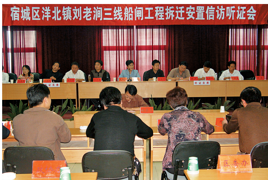
图 25-1 2004年，宿迁市创新开展无理上访老户信访听证终结制度

2008年7月2日，全市开展领导干部接待日活动。《宿迁日报》刊登县（区）委、县（区）人民政府领导成员工作分工情况、大接访活动值班表。县（区）级党政主要领导按时接待上访群众，实施首办负责制，负责包案督办，直至问题解决。活动期间，市、县、乡三级党政领导共接访4652批6868件次，现场会办解决信访问题2009件，交办并按期办结2516件，落实党政领导包案127件。2009年，市、县信访部门制定配套制度，出台公示、接访、办理、落实4个环节实施方案。市级党政领导接待来访群众35批86人次，县（区）领导干部接访735批1569人，所有案件均有效化解，化解率100%。2011年，市、县（区）两级领导干部下访1187次，化解信访问题1167件。