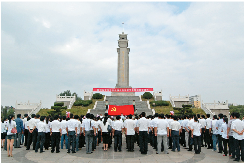
图 23-1 2011年7月1日，宿迁市举行建党90周年新党员集体宣誓活动

中共宿迁市委出台《关于进一步加强和改进机关党的建设的意见》，推行机关党建目标管理和目标任务落实。2007年，把信息工作纳入党建目标考核，推进机关党建信息工作。2008年，市级机关工委制定下发《关于对机关党建工作实行目标管理考核的意见》，对机关党建目标管理工作进行进一步规范。2011年，下发《关于推行机关党建工作质量标准化管理的意见》，对市级机关党建各项工作进行全面优化、量化，形成明确的工作质量评价标准和可控制的管理、服务程序。按照机关党建工作质量标准化管理要求，市级机关工委每年年初结合年度重点工作制定下发考核细则，年终通过考核评选表彰机关党建质量标准化管理先进单位。2009—2011年，市级机关工委连续3年获省级机关工委信息工作一等奖，位居全省13个设区市首位。