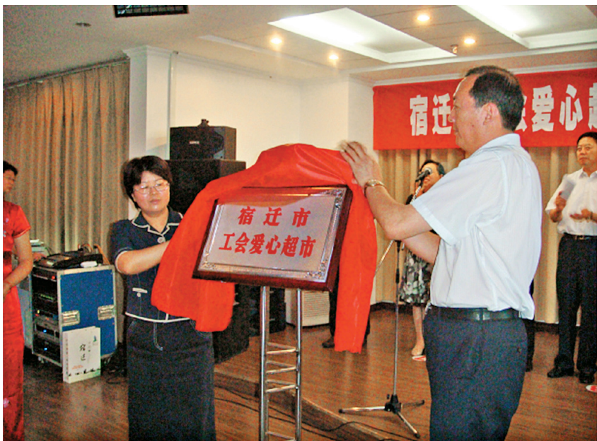
图28-1 2008年6月20日,宿迁市举行工会爱心超市揭牌暨帮扶资金账户开通仪式

“送温暖” 1998年,建立特困职工档案2148份,发放特困证1480个,建立互助补充保险组织13个,参保职工达8.1万人。2000年元旦、春节期间,全市各级工会组织共筹集送温暖资金325.7万元,走访慰问困难企业259家,慰问困难、伤残职工和劳模、离退休人员1.33万名。2003—2007年,全市各级工会组织共筹集、发放送温暖资金2301万元,走访慰问困难企业1946家(次),慰问困难职工37683户(次)。2008年,市、县(区)总工会核定的10992名特困职工被列入政府救助范围。市、县(区)联动开展对困难职工“冬季送温暖,春季送健康,夏季送清凉,秋季送学费”的“四送”活动。元旦、春节期间,筹集送温暖资金495.21万元,慰问困难职工10234户。2008年12月,市总工会被中华全国总工会表彰为“全国困难职工帮扶中心工作先进集体”。2009年,将失业返乡的困难农民工全部纳入帮扶范围,建立33个农民工爱心超市,经常化救助对象4300人。设立“特殊困难职工爱心救助网络平台”,对因大病大灾造成的特殊困难职工、农民工实施救助。经过整合各方资源,全市各级工会共筹集送温暖资金497.32万元,慰问困难职工1.44万户;建立8638份困难职工档案,为4935名特困职工实施长效帮扶。2010年,筹集各类帮扶资金560万元,建成工会爱心超市43个,经常化救助对象4543人,为150名因大病大灾致贫职