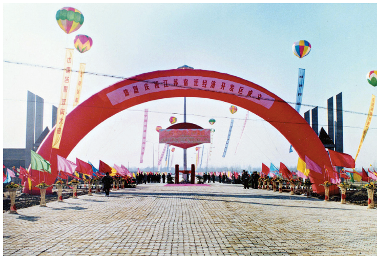
图 14-1 1998年12月8日，宿迁经济开发区正式揭牌

1998年，开始筹建。4月，成立宿迁经济开发区筹备领导小组。6月，中共宿迁市委同意成立中共宿迁经济开发区工作委员会和宿迁经济开发区管理委员会。7月，成立宿迁市