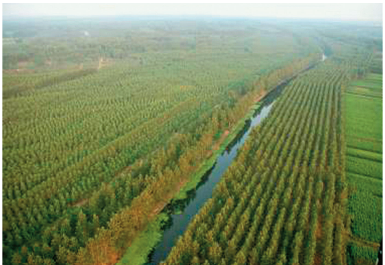
图16-1 废黄河沿线杨树林

1996年设区市成立后，市委、市政府把发展战略定位为“森林式、环保型、园林化、可持续发展的湖滨生态城市”。每年植树节前后，市党政主要领导都参加义务植树活动。市绿化委员会办公室每年年初都发出做好义务植树组织发动和绿化管护工作的通知。2001年起，全市持续开展“杨树产业年活动”。同年，全市成片林面积发展到800平方千米，农田林网580万棵，四旁树保存1亿棵，林木覆盖率16.2%。2005年，市政府出台《宿迁市贯彻〈江苏省全民义务植树条例〉实施办法》。2006年，市政府出台《宿迁市绿地认建认养实施办法》，规定在城市规划区范围内的公园、街头绿地、居住小区绿地、道路绿地、大环境片林以及古树名木，都可以由单位或个人认建和认养。每年植树节期间，各级绿委办公室都要组织形式多样的义务植树活动和各类“主题”活动。至2011年，全市拥有林地2013平方千米，建成高标准农田林网4133平方千米，活立木蓄积210万立方米，森林覆盖率达27.22%。成片林267.58平方千米，活立木蓄积1532.78万立方米，林木覆盖率达到28.18%。全市全民义务植树工作已形成制度化、规范化、法制化。全市义