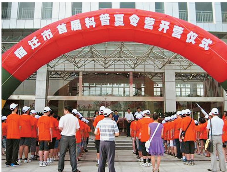
图 28-2 2011年7月28日,宿迁市首届科普夏令营开营仪式

科普宣传周 1996—2001年,全市每年组织一次以科学普及为主题的科普宣传周活动。从2002年起,每年5月第三周举行科普宣传周活动。2005年,开展防震减灾宣传教育活动。2006年,开展“科普大篷车苏北百乡行”活动。2008年,组织参加百万农民社会主义新农村建设知识竞赛活动。2010年,举办宿迁市首届科普知识大赛。2011年,举办宿迁市首届科普夏令营活动,组织百余名科技爱好者到市未成年人社会实践基地及省内科普教育基地参观学习。至2011年年末,泗阳县双语实验学校、宿豫区张家港实验小学成功创成省级科学教育特色学校。