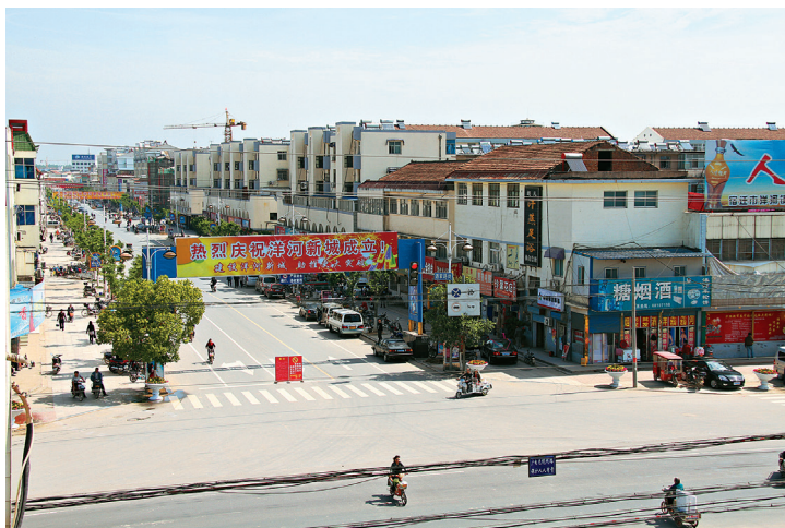
图14-3 洋河新城成立之初的酒家路

洋河新城位于宿迁市区东南18千米,东距泗阳县城30千米,南距泗洪县城41千米,北依京杭大运河。徐淮、徐宁公路在此交汇。宁宿徐、徐宿淮盐两条高速公路横贯东西,宿淮铁路宿迁站位于城区内。因洋河酒厂坐落在此而得名。2011年4月29日,为策应江苏省强镇扩权试点工作,推进宿迁中心城市“一核多极”发展举措,市委、市政府决定成立洋河新城。洋河新城下辖洋河镇。至2011年年底,共辖西门、平安、大圩、新南园、东圩、东关、三葛、南街8个居委会和冯桥、富强、中兴、闸口、红庙、葛罗、马元、黄庄、兴跃、果园、黄桥、桥北、赵圩、卓玛、王园、李官庄16个行政村,总面积89.98平方千米,人口11.32万人。