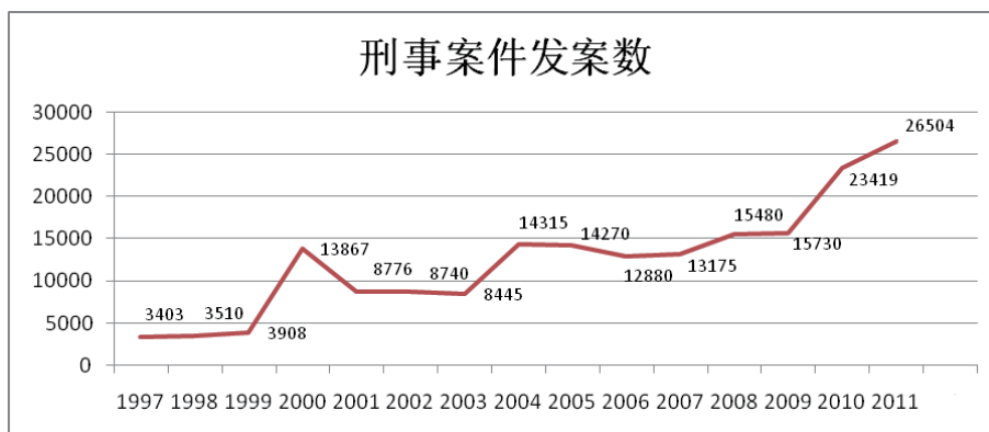
图 29-1 1997—2011 年宿迁市刑事案件发案数示意图

1997—2011年，全市盗窃、抢劫、诈骗、抢夺等侵财性案件占全部刑事案件的主导地位。随着社会经济的发展，此类犯罪日渐突出，数量不断上升，所占比例不断加大。